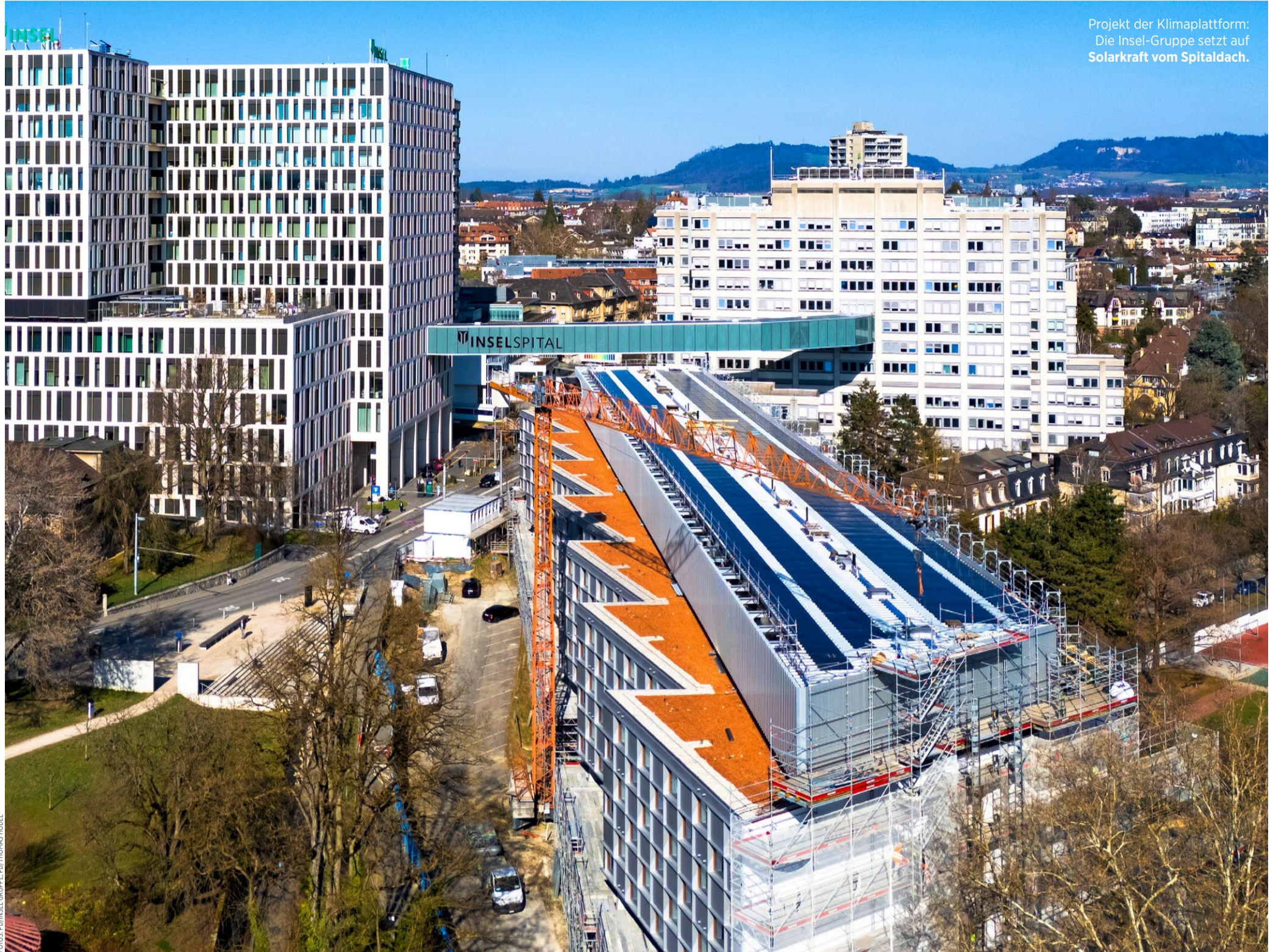
Projekt der Klimaplatform: Die Insel-Gruppe setzt auf Solarkraft vom Spitaldach.

● KREISLAUFWIRTSCHAFT braucht Freiheit statt Paragraphen. Seite 47